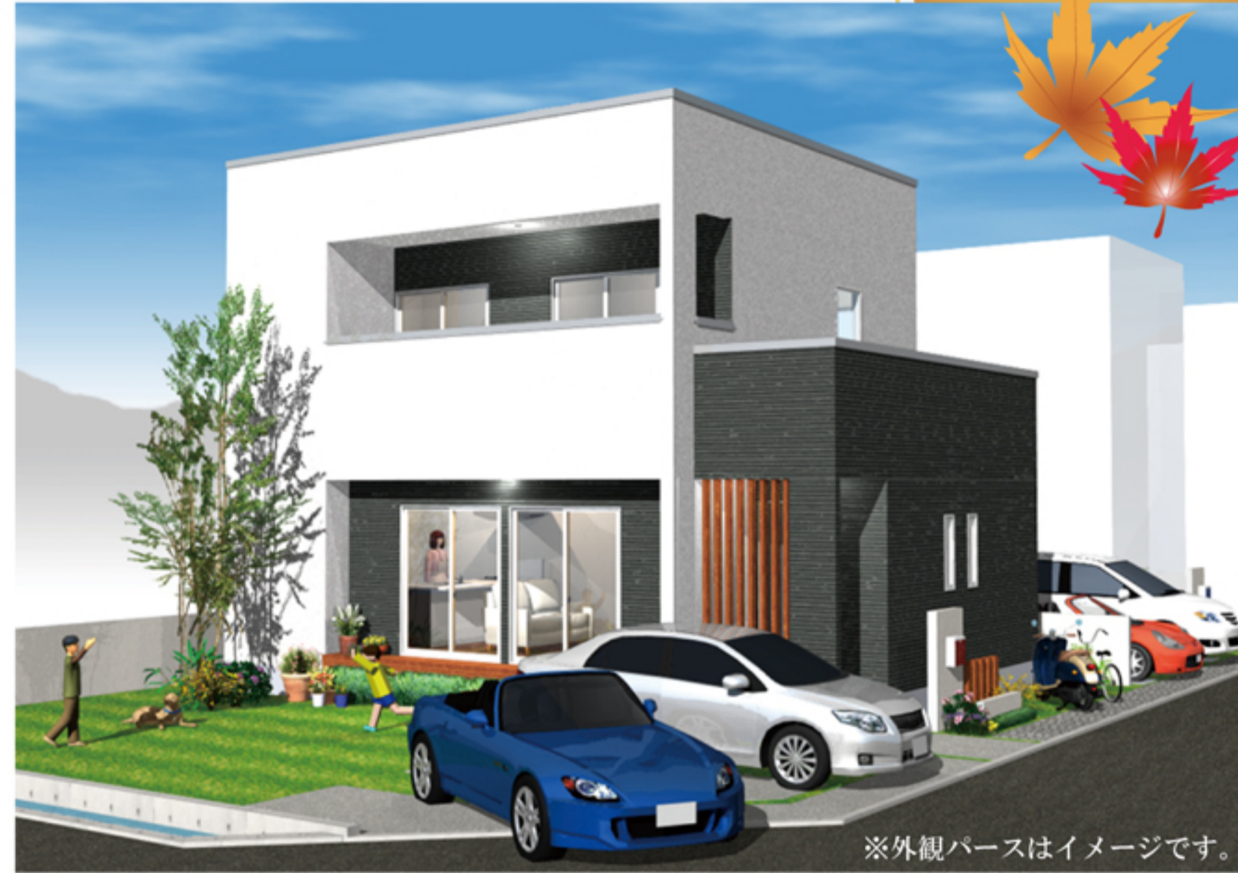
※外観パースはイメージです。